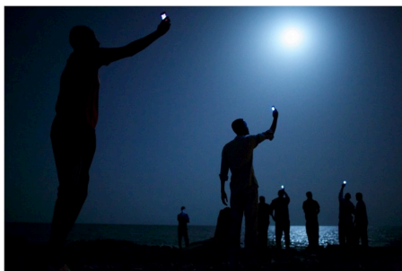
AMERICAN PHOTOGRAPHER JOHN STANMEYER WINS WORLD PRESS PHOTO OF THE YEAR 2013

Esta idea creo que está plasmada a la perfección en la siguiente foto.