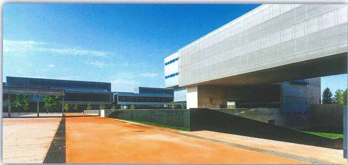
Edificio actual de la Escuela Politécnica Superior de Linares

Este año se han cumplido 125 desde la creación en Linares de la Escuela de Capataces de Minas y Maestros Fundidores, allá por 1892, antecedente de la Escuela de Facultativos de Minas. Tuvieron que pasar 67 años para que dos mujeres entraran a cursar y completar unos estudios tradicionalmente reservados a los hombres. Es por ello que desde estas páginas les reconocemos que abrieran nuevos caminos y les agradecemos la gentileza de haber atendido a nuestras preguntas.