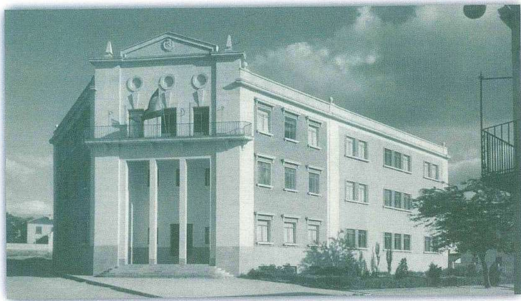
Antiguo edificio de la Escuela de Facultativos de Minas y Peritos de Minas