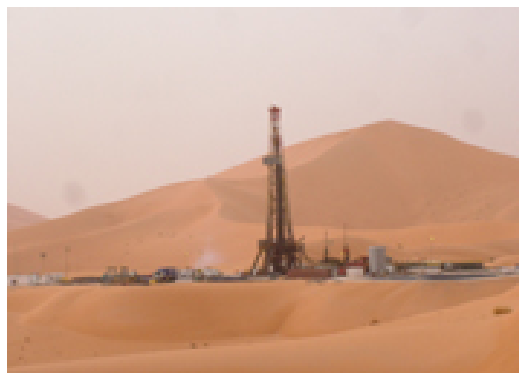
Yacimiento RKF (Argelia)